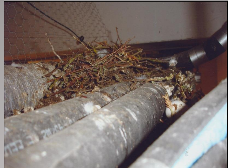
Die Kabelbrücken über dem Parkplatz Dolphin Yard waren zu einem Nistplatz für Tauben geworden.